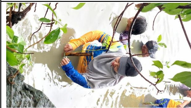
Gambar 3. Foto Proses Penanaman