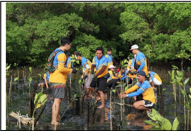
Gambar 1. Foto Peserta Penanaman