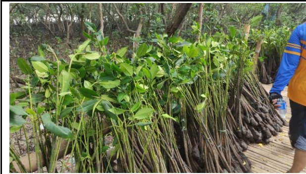
Gambar 1. Foto Bibit Sebelum Ditanam