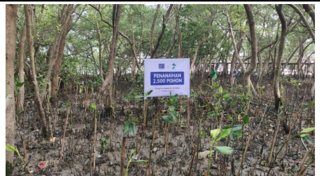
Gambar 6. Foto Plang Penanaman