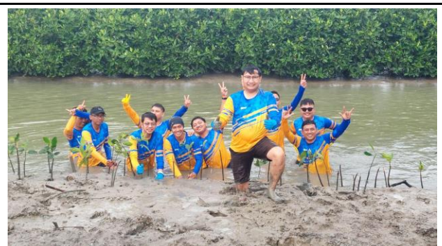
Gambar 6. Foto Proses Penanaman