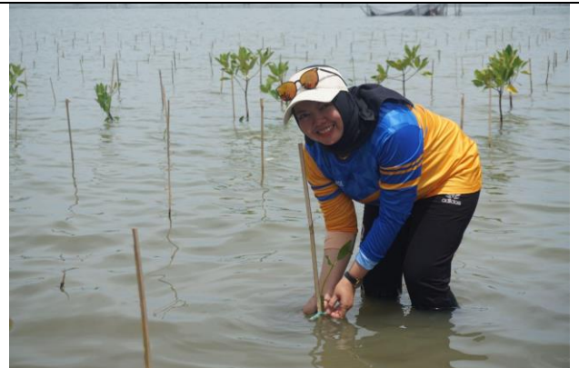
Gambar 2. Foto Proses Penanaman