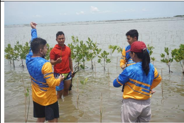
Gambar 3. Foto Proses Penanaman