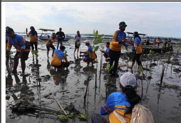
Gambar 3. Foto Proses Penanaman