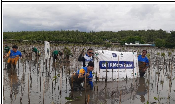
Gambar 3. Foto Proses Penanaman