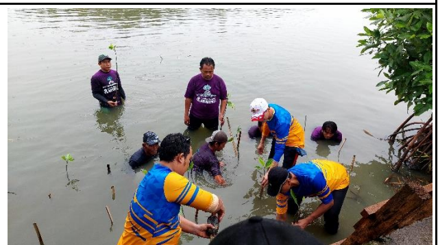
Gambar 6. Foto Proses Penanaman