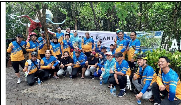
Gambar 1. Foto Peserta Penanaman