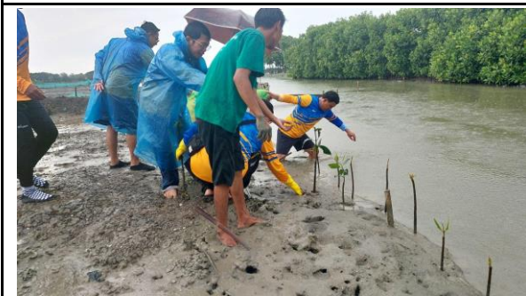
Gambar 3. Foto Proses Penanaman