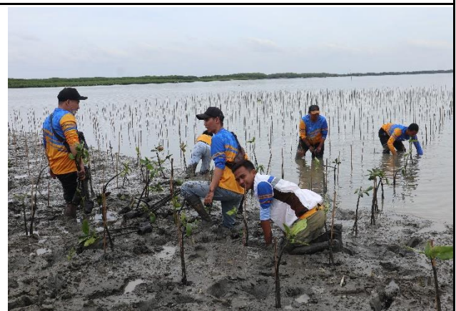
Gambar 4. Foto Proses Penanaman