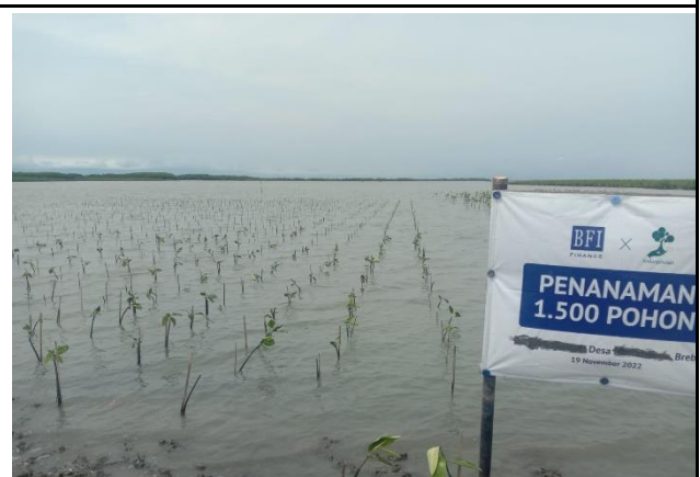
Gambar 6. Foto Proses Penanaman