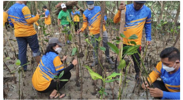
Gambar 4. Foto Proses Penanaman