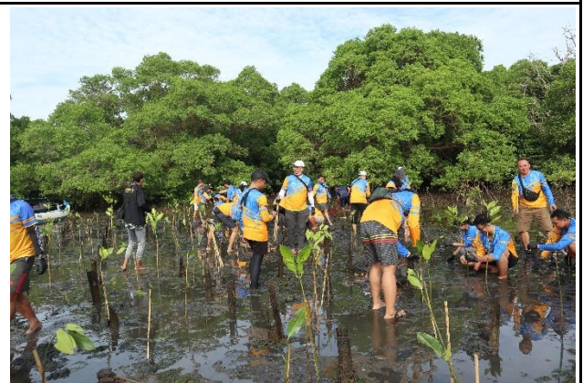
Gambar 4. Foto Proses Penanaman