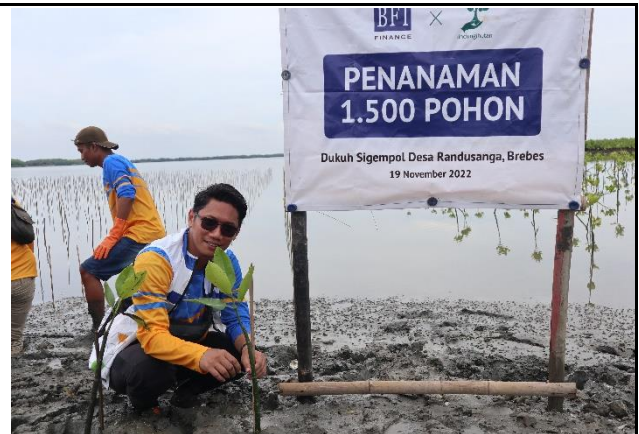
Gambar 2. Foto Proses Penanaman