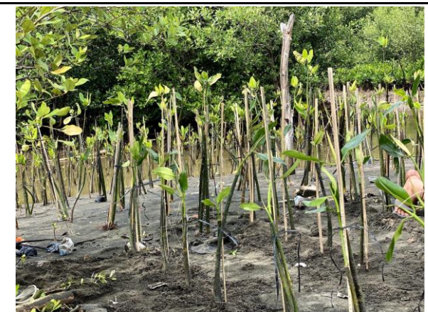
Gambar 6. Foto Bibit Setelah Ditanam