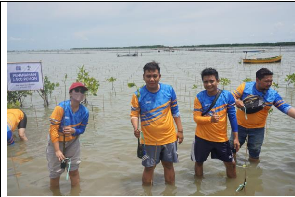
Gambar 1. Foto Proses Penanaman