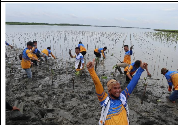
Gambar 5. Foto Proses Penanaman