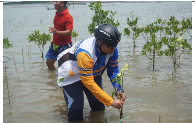
Gambar 4. Foto Proses Penanaman