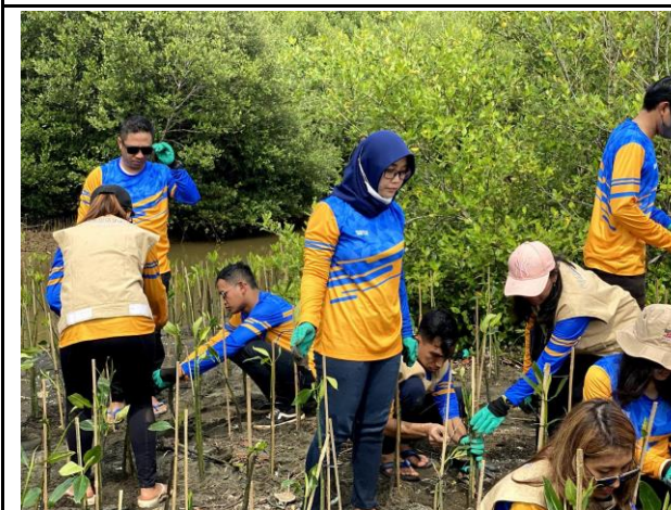
Gambar 3. Foto Proses Penanaman