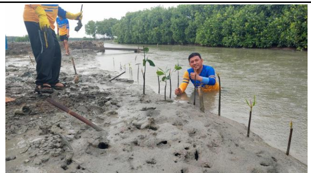
Gambar 4. Foto Proses Penanaman