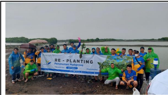
Gambar 1. Foto Peserta Penanaman