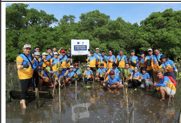
Gambar 5. Foto Proses Penanaman