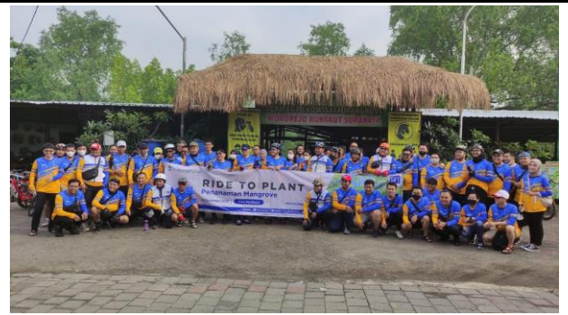
Gambar 2. Foto Peserta Penanaman