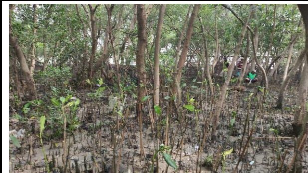
Gambar 5. Foto Bibit Setelah Ditanam