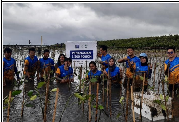
Gambar 5. Foto Proses Penanaman