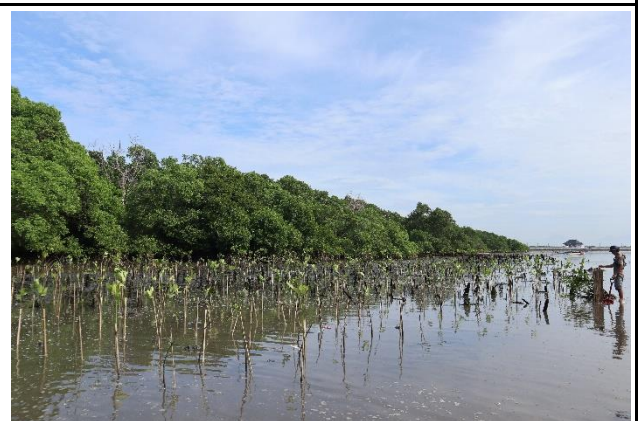
Gambar 6. Foto Proses Penanaman