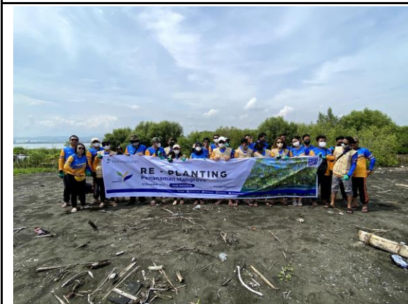
Gambar 5. Foto Peserta Penanaman