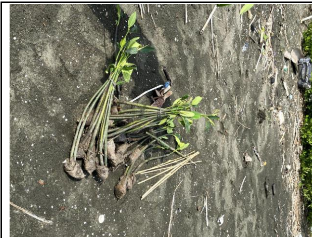
Gambar 1. Foto Bibit Sebelum Ditanam