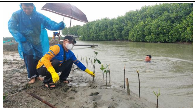
Gambar 2. Foto Proses Penanaman