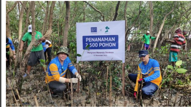
Gambar 3. Foto Proses Penanaman