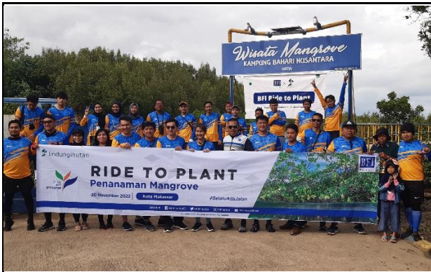
Gambar 1. Foto Peserta Penanaman