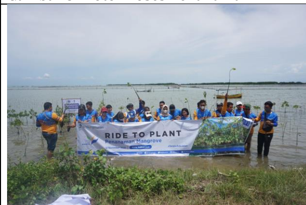
Gambar 5. Foto Peserta Penanaman