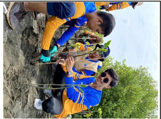
Gambar 2. Foto Proses Penanaman