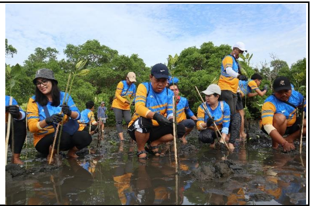
Gambar 2. Foto Proses Penanaman