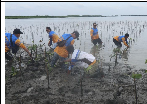
Gambar 3. Foto Proses Penanaman