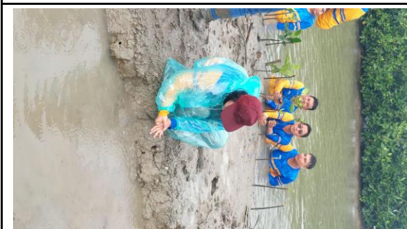
Gambar 5. Foto Proses Penanaman