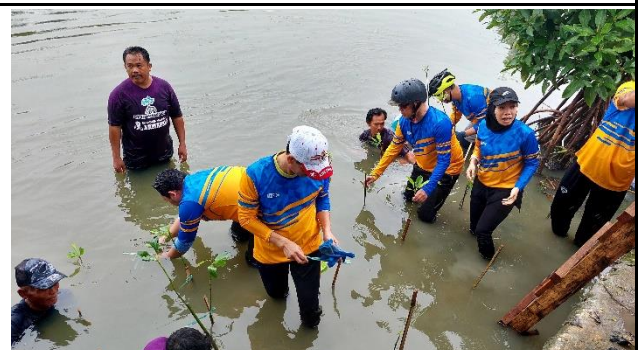
Gambar 4. Foto Proses Penanaman