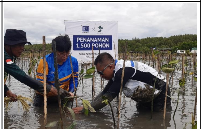
Gambar 6. Foto Proses Penanaman