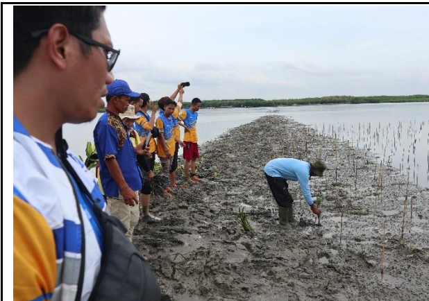
Gambar 1. Foto Peserta Penanaman