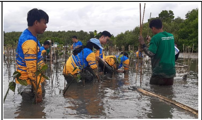
Gambar 2. Foto Proses Penanaman