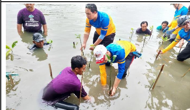
Gambar 5. Foto Proses Penanaman