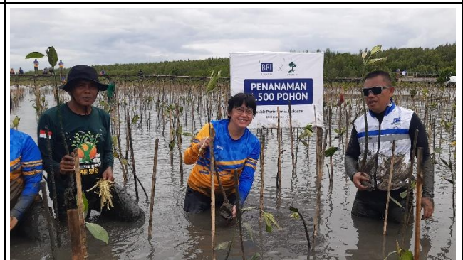
Gambar 4. Foto Proses Penanaman