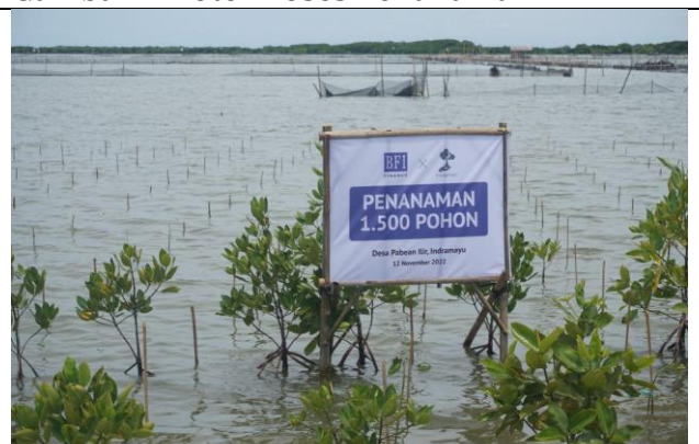
Gambar 6. Foto Plang Penanaman