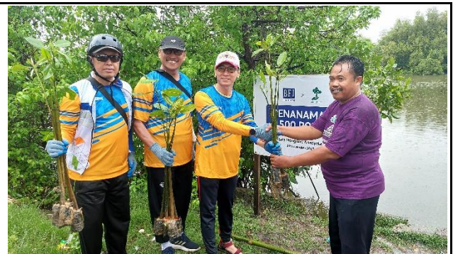
Gambar 2. Foto Proses Penanaman