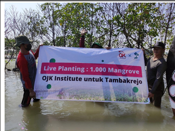
Gambar 5. Peserta Penanaman