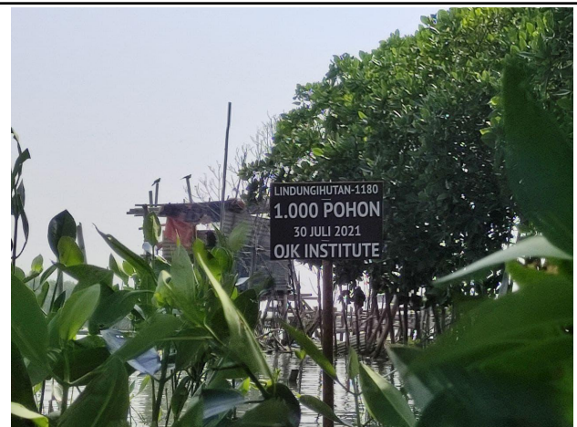
Gambar 4. Signage Penanaman