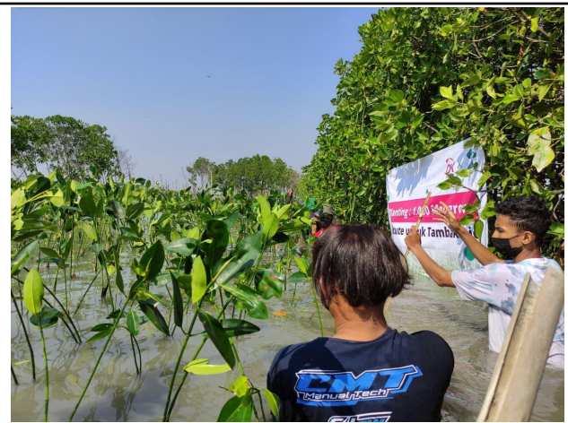
Gambar 2. Proses Penanaman