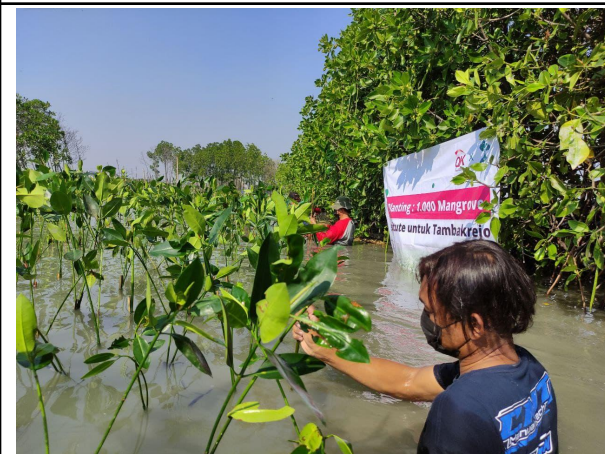
Gambar 3. Proses Penanaman