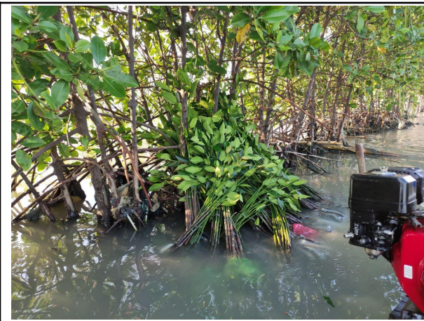
Gambar 1. Bibit Sebelum Ditanam