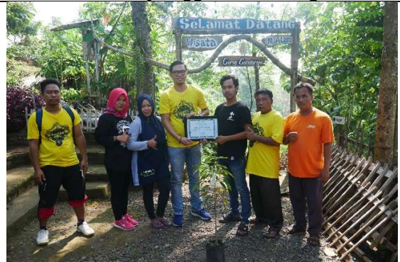
Gambar 6. Foto penyerahan piagam