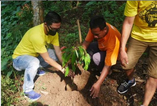
Gambar 5. Foto saat penanaman