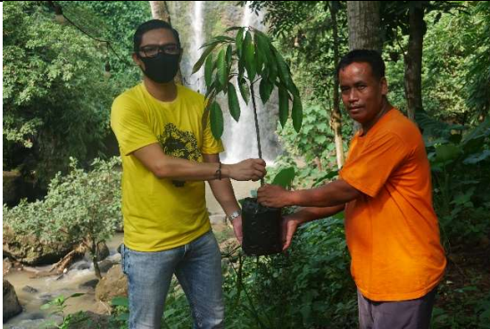
Gambar 3. Foto penyerahan bibit