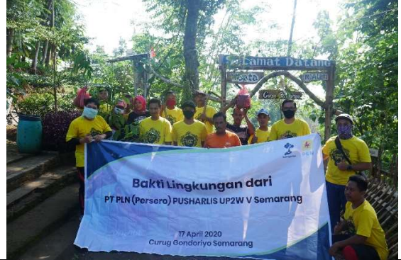
Gambar 2. Foto bersama sebelum penanaman