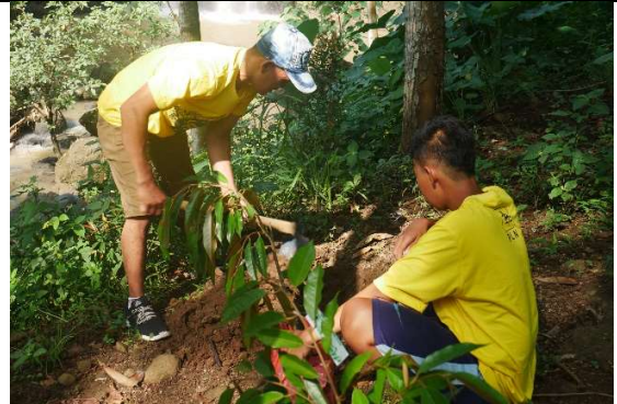
Gambar 4. Foto penggalian lubang