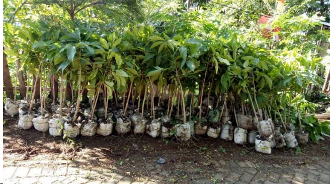
Gambar 1. Foto bibit sebelum ditanam