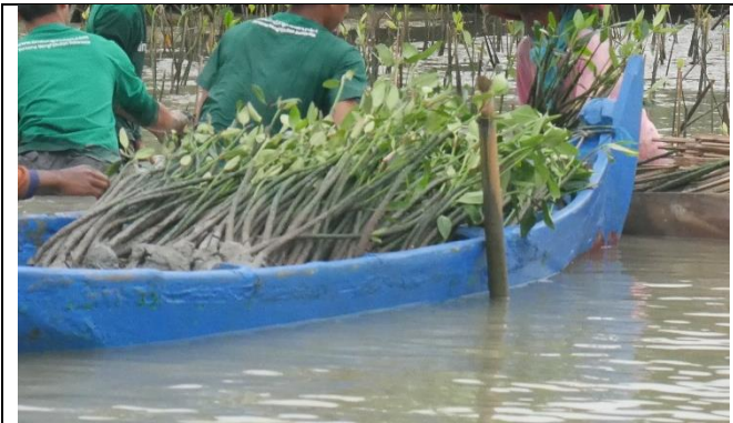
Gambar 1. Foto Bibit sebelum penanaman