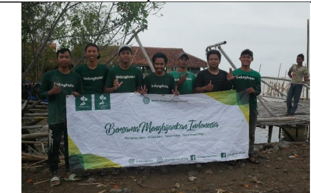
Gambar 6. Foto peserta penanaman