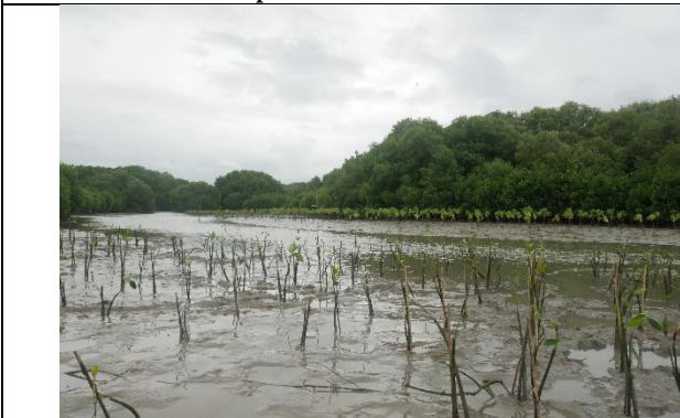
Gambar 5. Foto bibit setelah ditanam