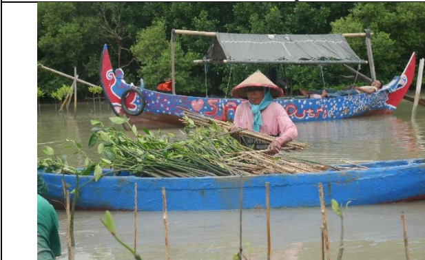
Gambar 3. Foto petani bibit