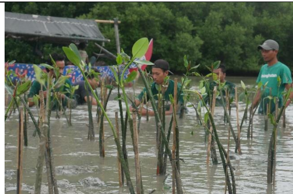
Gambar 2. Foto saat penanaman