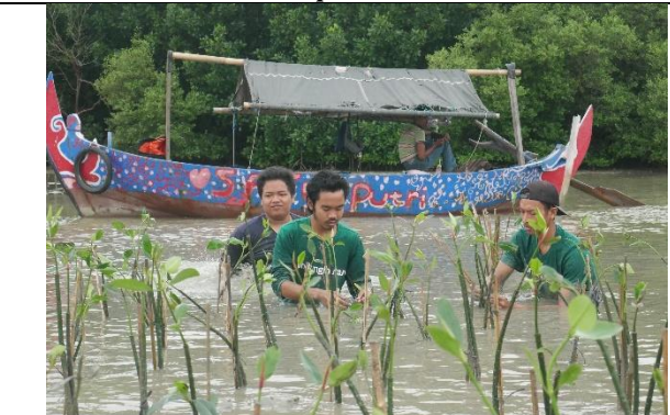
Gambar 4. Foto saat penanaman