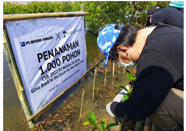
Gambar 4. Foto proses penanaman