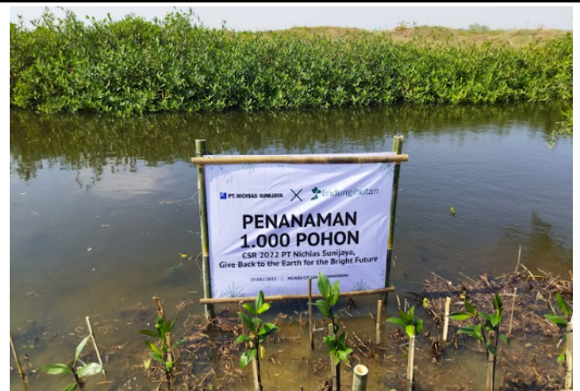
Gambar 6. Foto plang penanaman