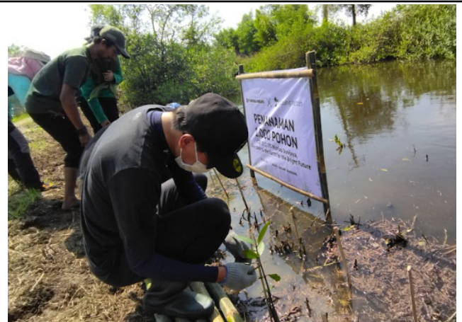
Gambar 2. Foto proses penanaman