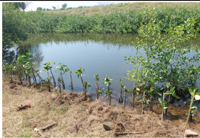
Gambar 5. Foto lokasi setelah ditanam