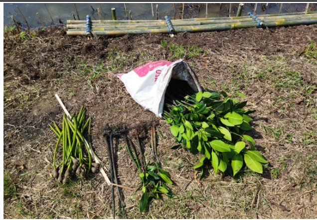
Gambar 1. Foto Bibit Sebelum Ditanam